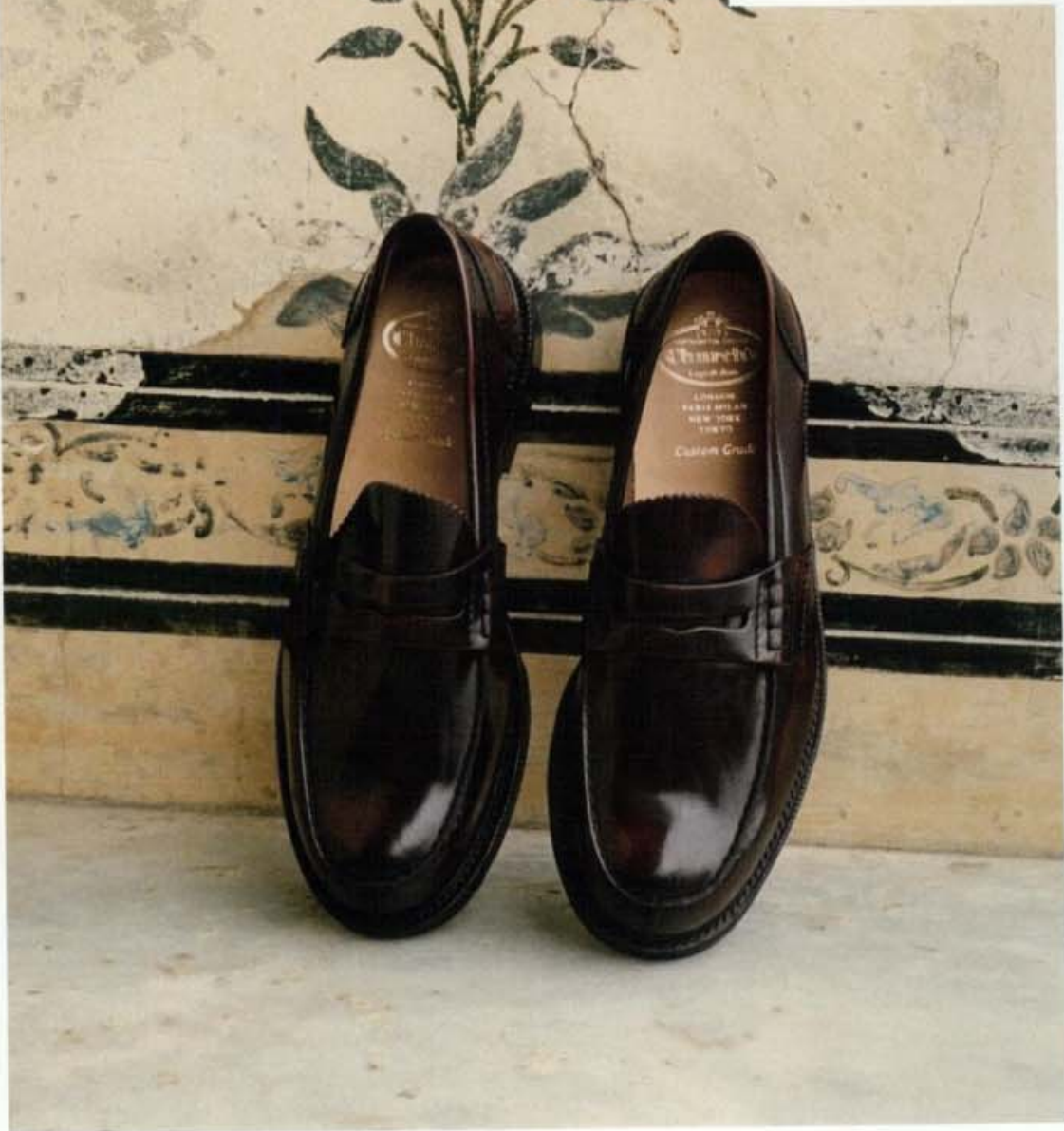
en esta página_ LOEWE, bolsa con manta y cantimplora Feder Bag Pecan Color (1.500 €), CHURCH'S, mocasines en cuero color borgoña (550 €). página anterior_ CALVIN KLEIN 205W39NYC, camisa vaquera en tono verde menta (c. p. v.).