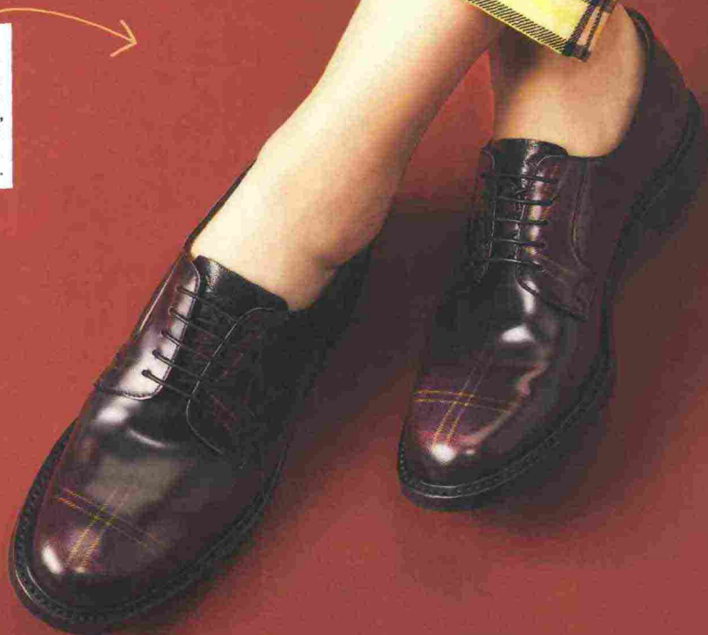
TRUCCO KATJA WILHELMUS @CLOSEUPMILANOAGENCY USING I COLONIALI. CAPELLI EMILIANO RICCARDI @ GREENAPPLE USING BUMBLE AND BUMBLE.