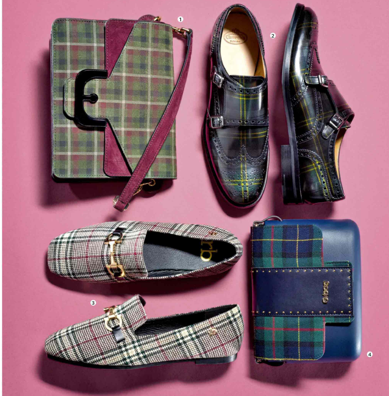
1. Borsa a tracolla di camoscio stampato, Coccinelle (€ 450). 2. Scarpe maschili con dettagli di lana tartan, Churoh (€ 520). 3. Mocassini di tweed, Rb by Roccobarocco (€ 39,90). 4. Tracolla di materiale XL Extralight con pattina intercambiabile, O bag (€ 101).

Gli accessori amano il tartan: in versione integrale o solo per un dettaglio. La quadrettatura colpisce ancora