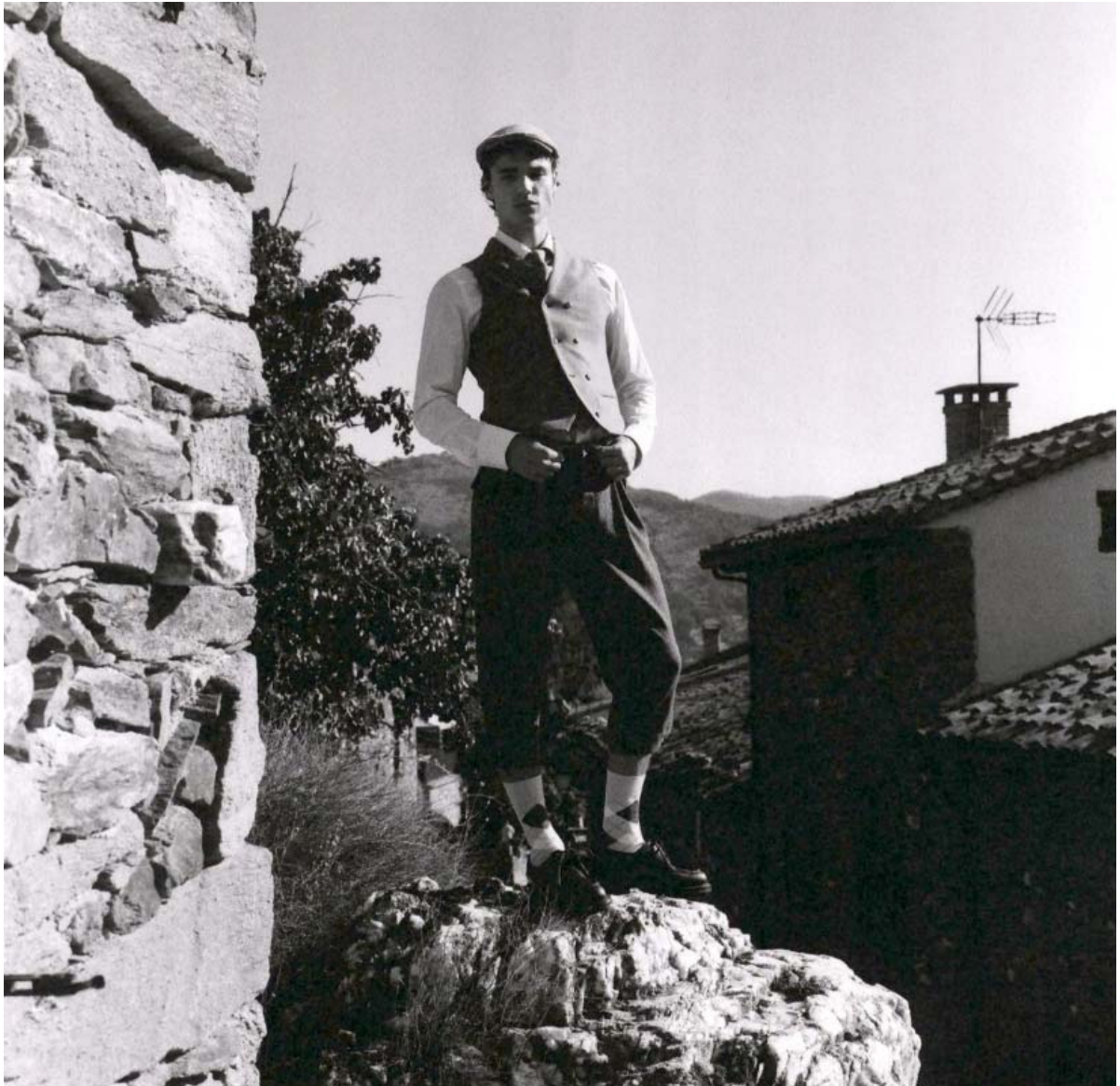
Esquire Spain Lymington Black