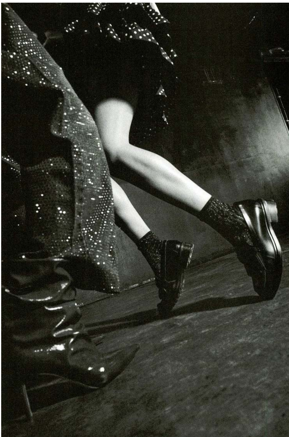
Madame Figaro Pembrey T Black