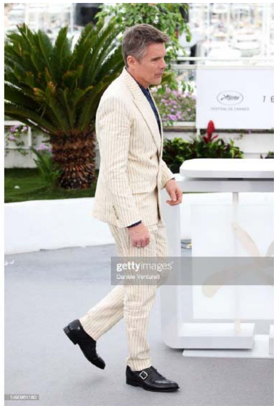
Ethan Hawke Cannes Film Festival "Strange Way Of Life" Photocall Westbury Black