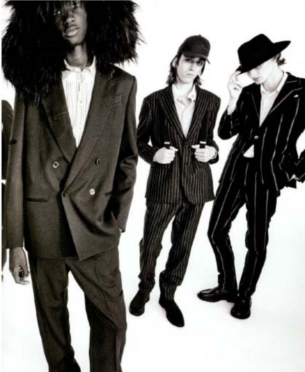
ITALIA - ICON - CHURCH'S - 01.06.23