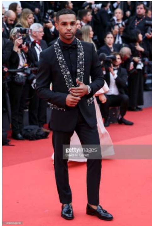
Lucien Laviscount Cannes Film Festival World Premiere of "Killers Of The Flower Moon" Kingsley Black