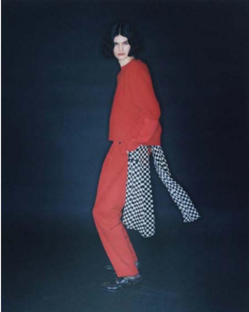
GRAN BRETAGNA - TANK - CHURCH'S - 01.06.23