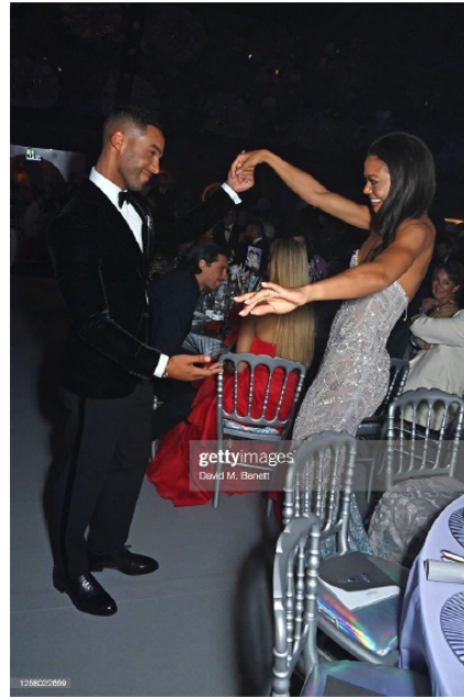
Lucien Laviscount amfAR Cannes Gala 2023 Consul Black