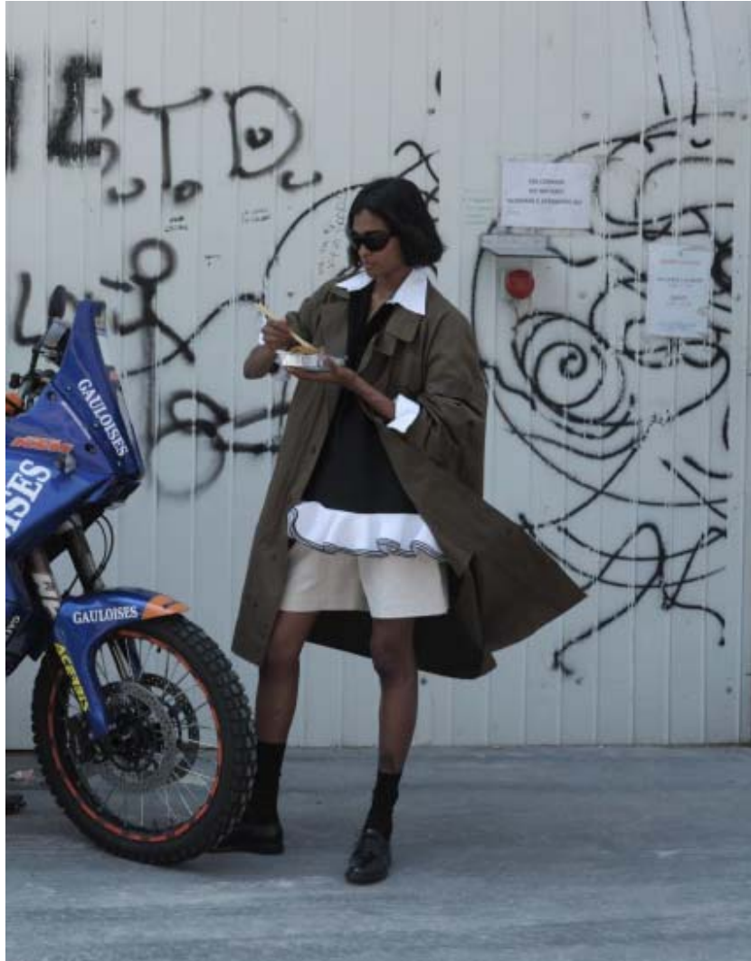
ITALIA - STUDIO - CHURCH'S - 01.06.23