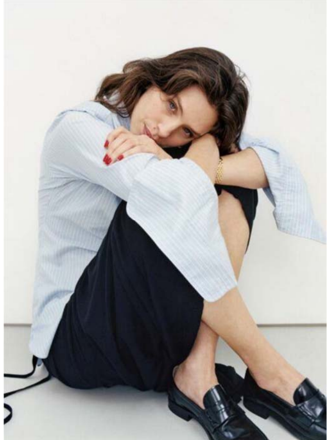
FRANCIA – HARPER'S BAZAAR – CHURCH'S – 01.06.23