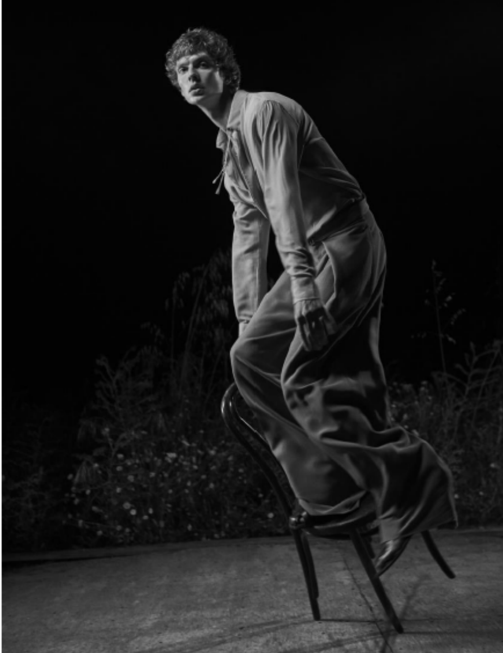
FRANCIA - M LE MONDE - CHURCH'S - 01.06.23