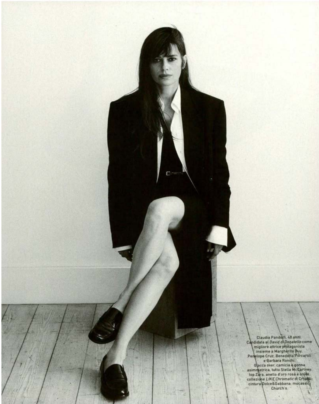
Claudia Pandolfi, 48 anni. Candidata al David di Donatello come migliore attrice protagonista insieme a Margherita Buy, Penelope Cruz, Benedetta Porcaroli e Barbara Ronchi. Giacca over, camicia e gonna asimmetrica, tutto Stella McCartney, top Zara, anello d'oro rosa e oro, collezione LIKE Chromatic di Church's, cintura Dolce&Gabbana, mocassini Church's.