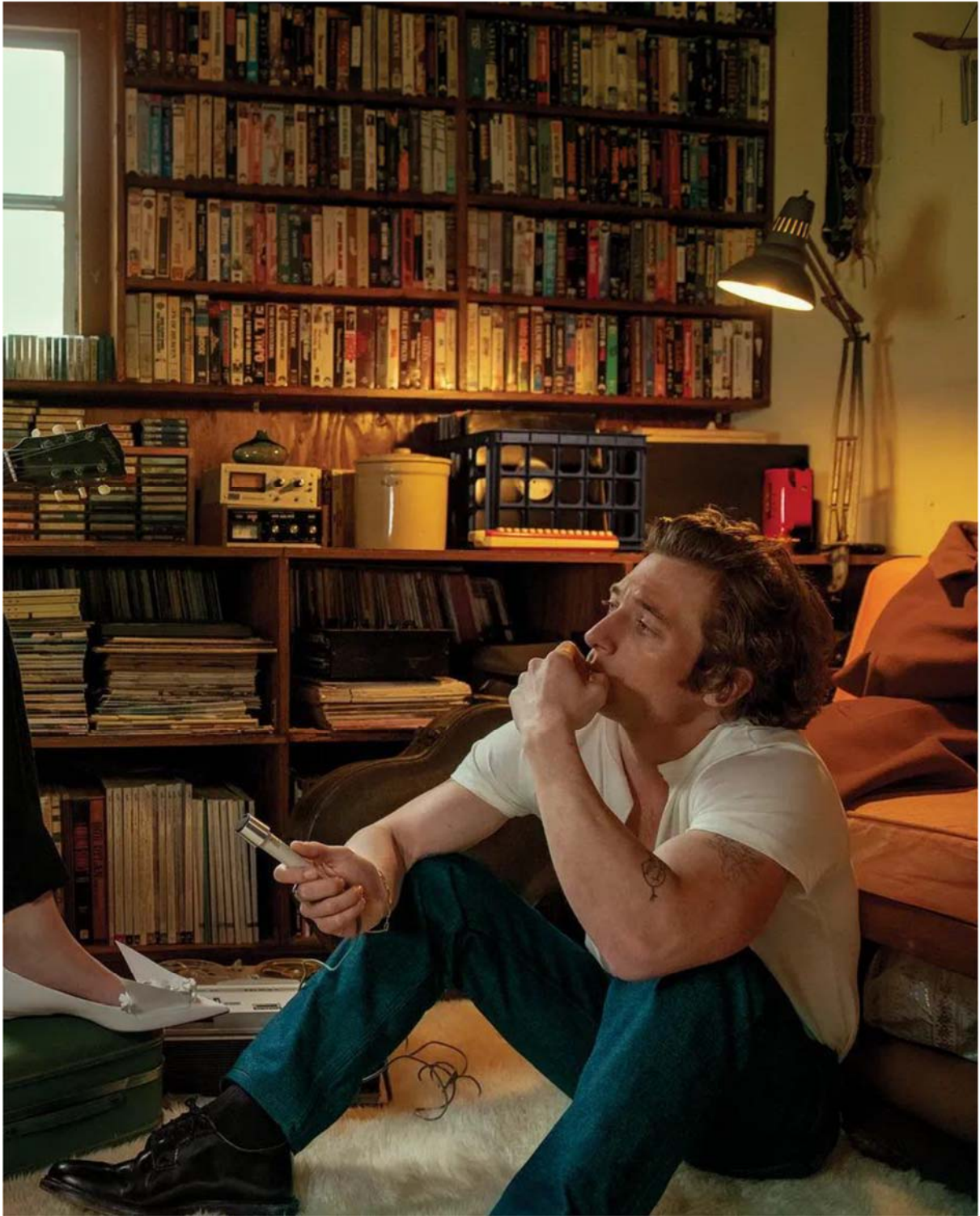
USA – VOGUE – CHURCH'S – 01.06.23