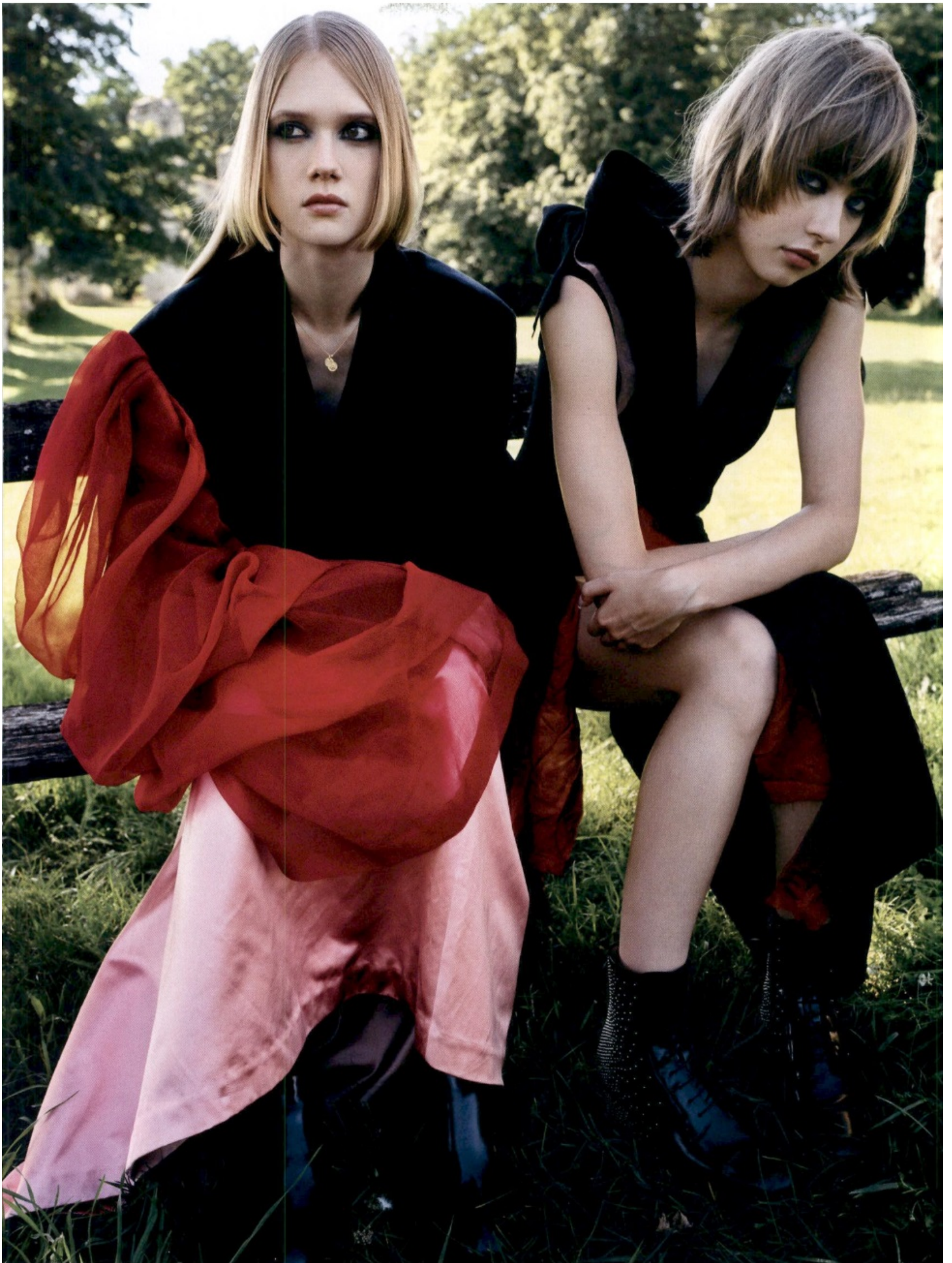
GRECIA - VOGUE GREECE - CHURCH'S - 01.09.21