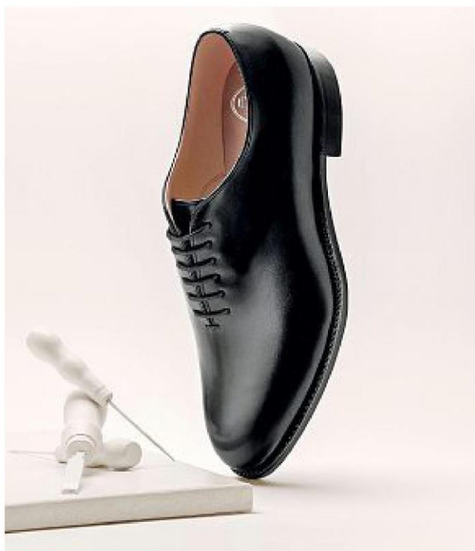
Caratteristica della collezione Royal di Church's (sopra il modello King): la lucidatura fatta con le dita, tecnica antica che richiede abilità estrema e massima concentrazione da parte degli artigiani.