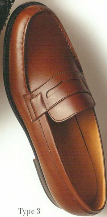
Type 3 Loafers