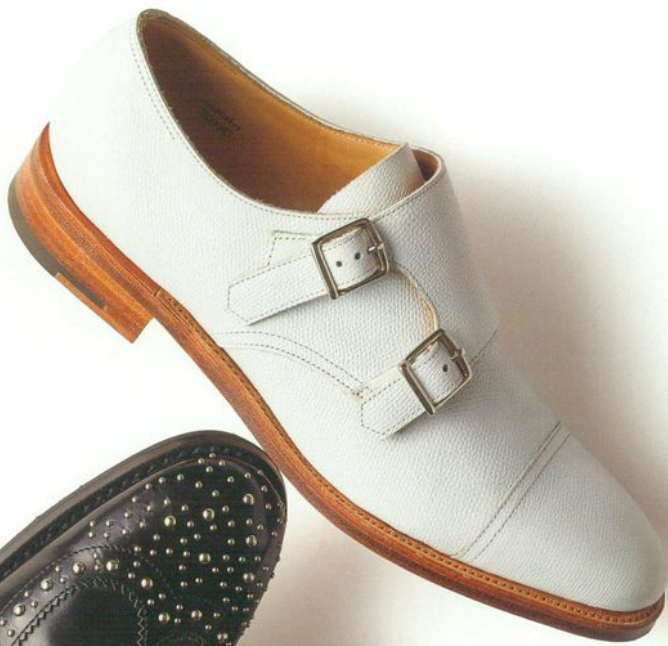
Type 1 Monk Strap