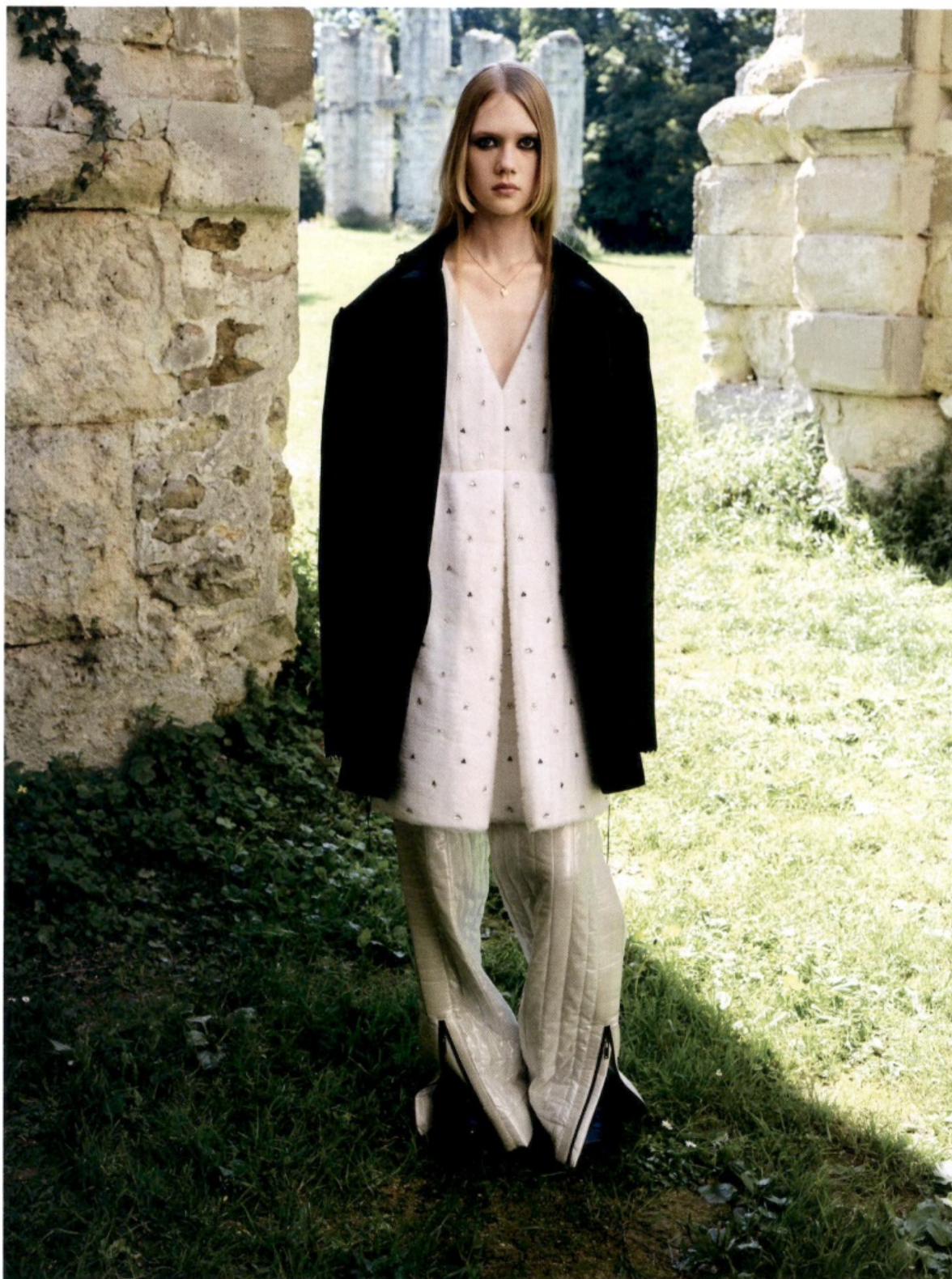
Μάλλινο παλιό, βαμβάκερό κομπονέ παντελόνι, μεταξωτό φόρεμα με κρύσταλλα και δερμάτινες μπότες, Louis Vuitton Boutique . Συν ανέναντι σεΛίδα: Μάλλινο σοκάκι με μανίκα από μεταξωτή οργάνζα και φούδια από Βαμβάκι και μετάξι, Dries Van Noten . Δερμάτινες μπότες, Alexander McQueen . Φόρεμα από μάλλινη καμπαρντίνα με απλοποιημένες λωρίδες από μεταξωτή ζορζέτα, Yohji Yamamoto . Δερμάτινα μισοτάκια, Church's x Noir Kei Ninomiya .