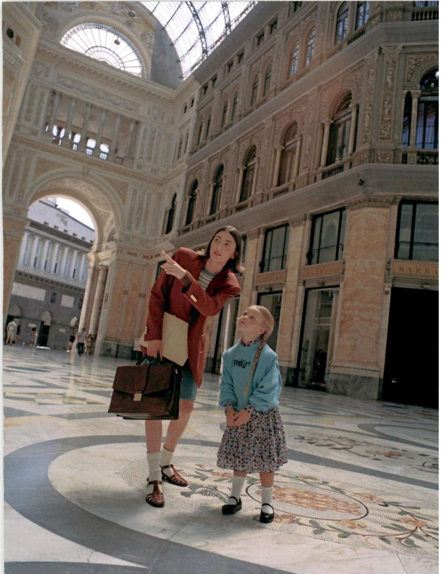
ITALIA - D REPUBBLICA - CHURCH'S - 28.08.21