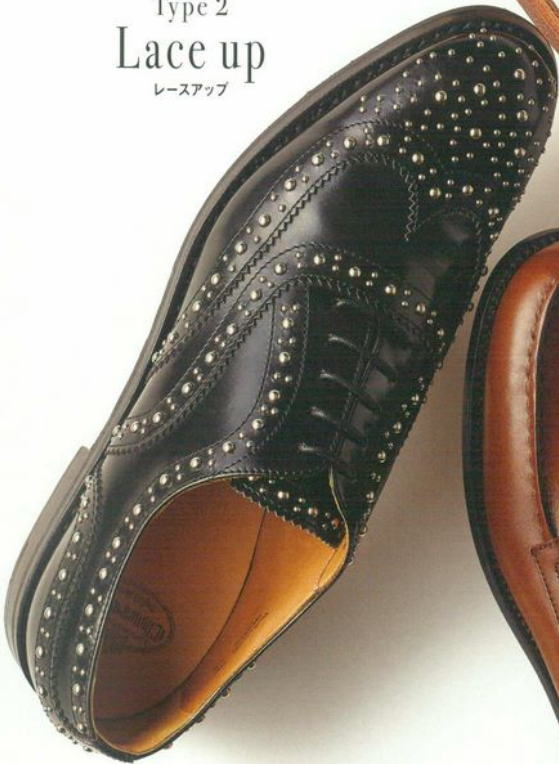
Type 2 Lace up レースアップ