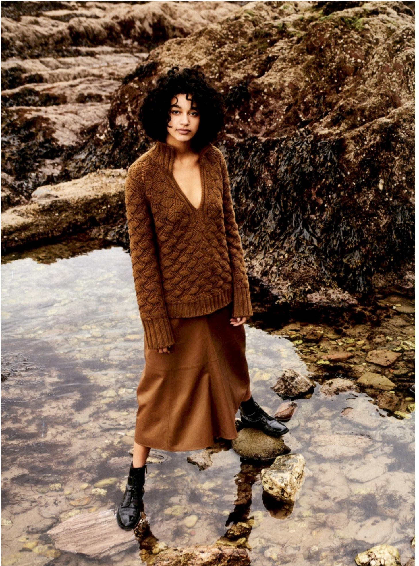
GRAN BRETAGNA - HARPER'S BAZAAR - CHURCH'S - 01.07.19