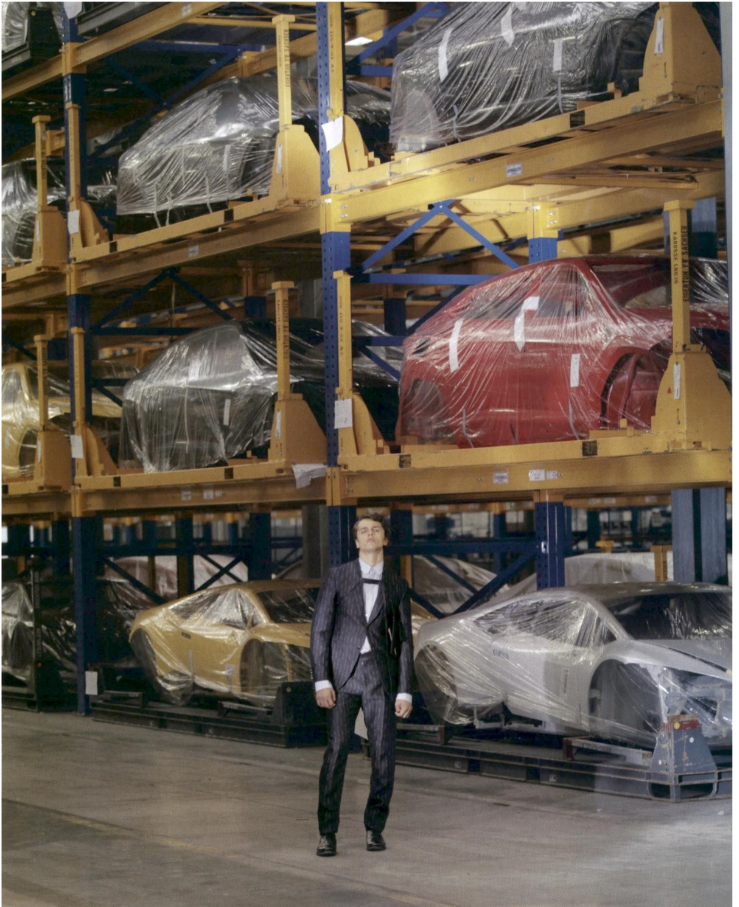
ITALIA - IL - CHURCH'S - 01.07.19