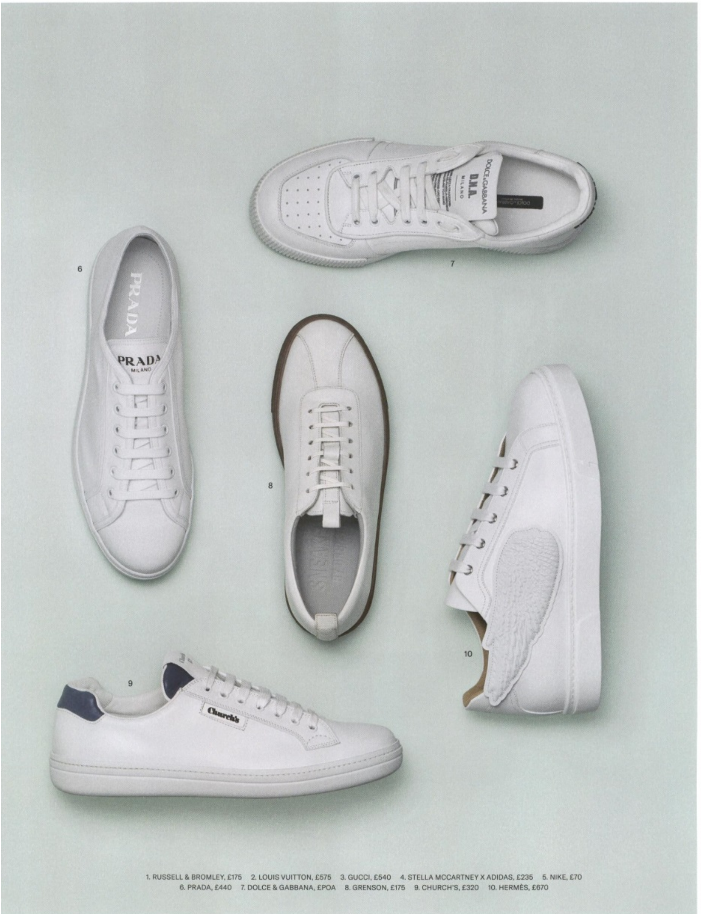
1. RUSSELL & BROMLEY, £175 2. LOUIS VUITTON, £575 3. GUCCI, £540 4. STELLA MCCARTNEY X ADIDAS, £235 5. NIKE, £70 6. PRADA, £440 7. DOLCE & GABBANA, £POA 8. GRENSON, £175 9. CHURCH'S, £320 10. HERMÈS, £670