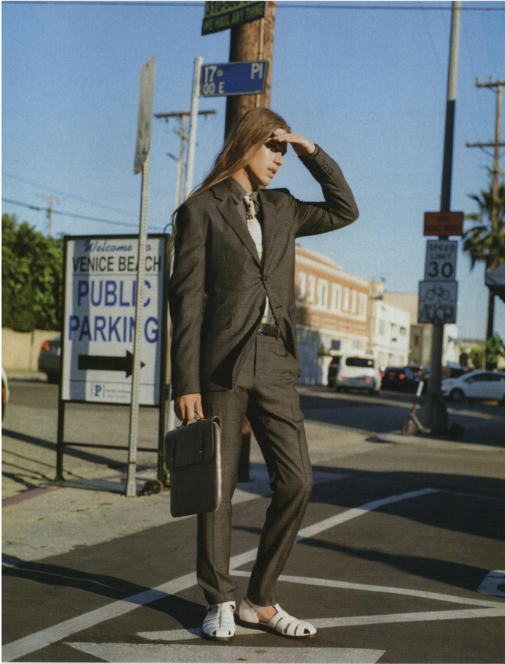
Arriba, traje, camisa y corbata PRADA. Las sandalias son CHURCH'S y el maletín, HERMÈS. A la derecha, traje GIORGIO ARMANI, camisa XACUS y corbata CANALI para YUSTY.