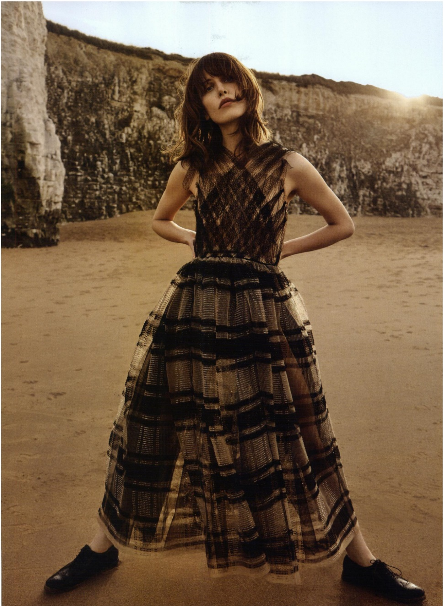
GRAN BRETAGNA - HARPER'S BAZAAR - CHURCH'S - 01.06.18