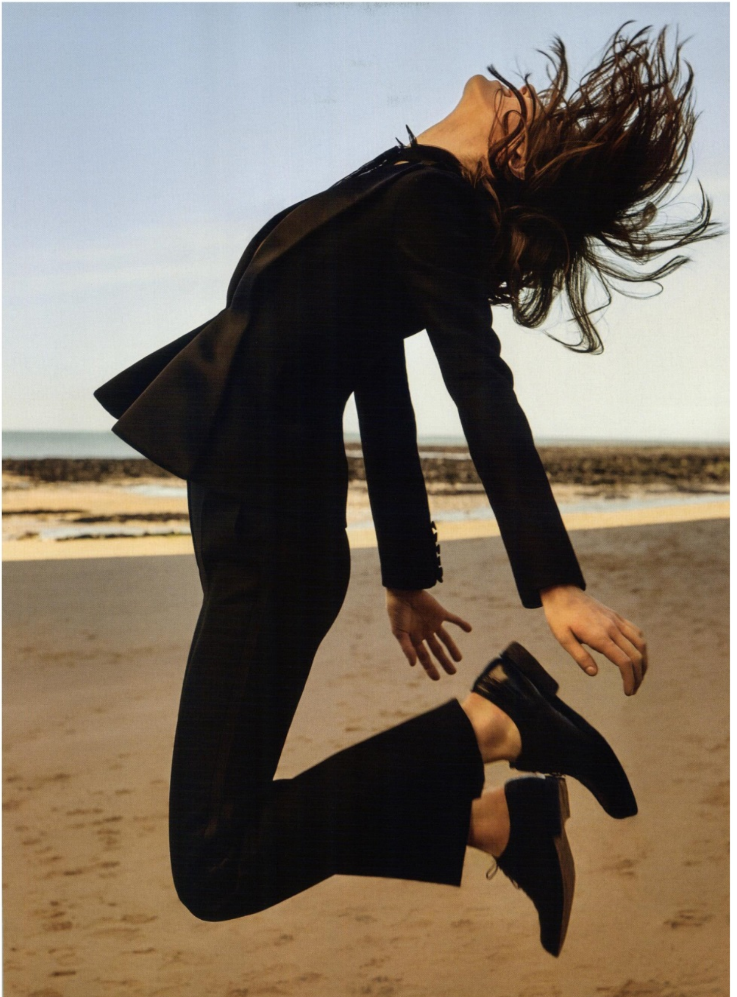
GRAN BRETAGNA - HARPER'S BAZAAR - CHURCH'S - 01.06.18